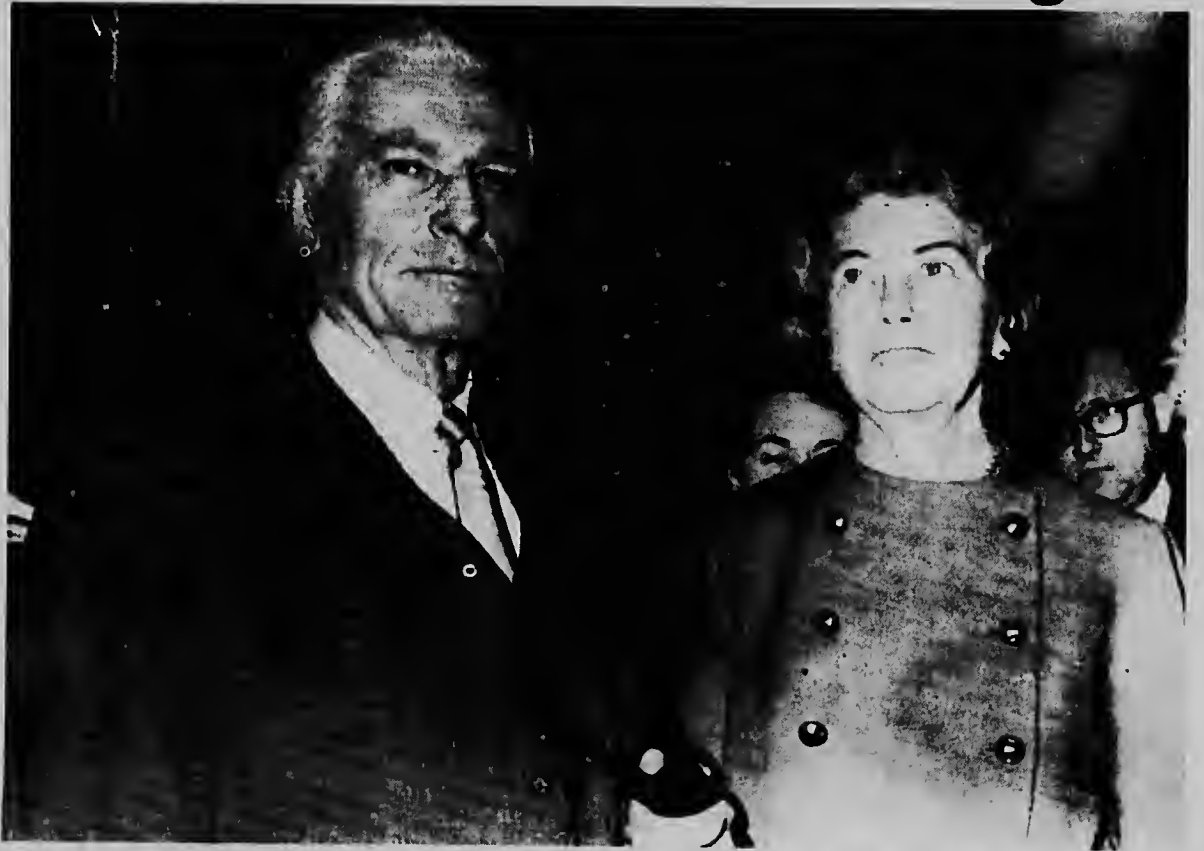
E senador Democra di Connecticut, Thomas Dodd algun tempu pasá a ser acusa den corant na Merca qu el a usa placa di campaña electoral pa su propio finnan. En relacion cu e denuncia aki, un comision di Senado a ordena pa investiga su andar y aki e ta yega huntu cu su casa pa presta testimonio.